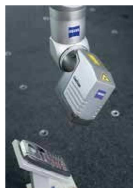
RDS + LineScan2