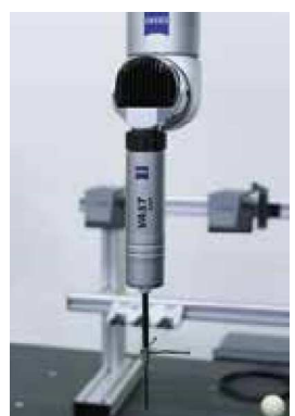
RDS + VAST XXT

2軸回転式ヘッドRDSは、水平、垂直のどちらの方向にも、5.0°ピッチで±180°回転するため、最大で5,184通りの位置決めが可能です。スキャンングプローブVAST XXTと組み合わせることにより、様々な角度で高精度首振りスキャンング測定を行うことができます。さらに、非接触式ラインレーザセンサ LineScan2の搭載も可能(オプション)。面計測による形状測定のリードタイムを短縮したい場合や、大量の点群データを取得してリバースエンジニアリングを行いたい場合に有効です。